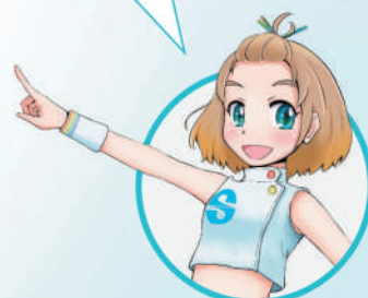
公式キャラクター りんちゃん

本体仕様 【定格電源】①本体：DC3.7V(リチウムイオン充電電池)、DC5.9V(ACアダプタ) ②ACアダプタ：AC100V 50/60Hz 【定格消費電力】12VA 【出力電流】最大1mA以下(実効値) 【出力電圧】最大10V±20%(ピーク値、500Ω負荷) 【出力周波数】最大100Hz 【タイマー】30分±5% 【電撃に対する保護の形式と程度】クラスII及び内部電源機器、BF形 【サイズ】(H)140×(W)69.4×(D)21.8mm 【重量】160g(リチウムイオン充電電池含む)