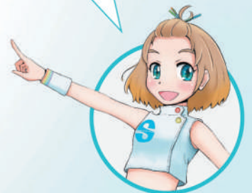
公式キャラクター りんちゃん

本体仕様 【定格電源】①本体：DC3.7V(リチウムイオン充電電池)、DC5.9V(ACアダプタ) ②ACアダプタ：AC100V 50/60Hz 【定格消費電力】12VA 【出力電流】最大1mA以下(実効値) 【出力電圧】最大10V±20%(ピーク値、500Ω負荷) 【出力周波数】最大100Hz 【タイマー】30分±5% 【電撃に対する保護の形式と程度】クラスⅡ及び内部電源機器、BF形 【サイズ】(H)140×(W)69.4×(D)21.8mm 【重量】160g(リチウムイオン充電電池含む)